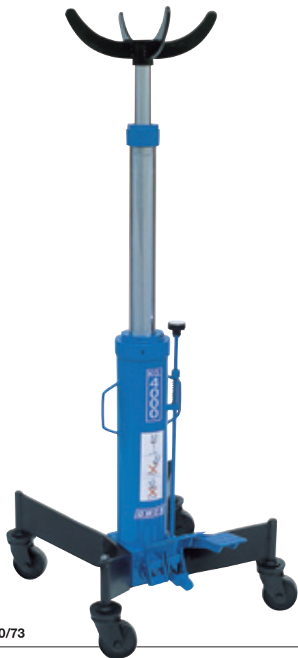
Art. SIF ST 10/73