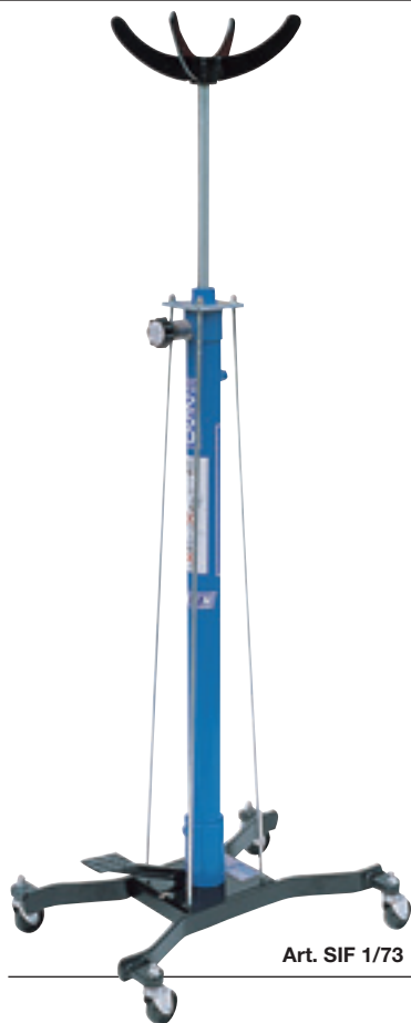
Art. SIF 1/73