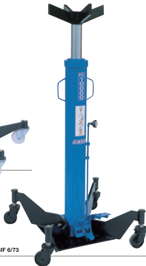
Art. SIF 6/73