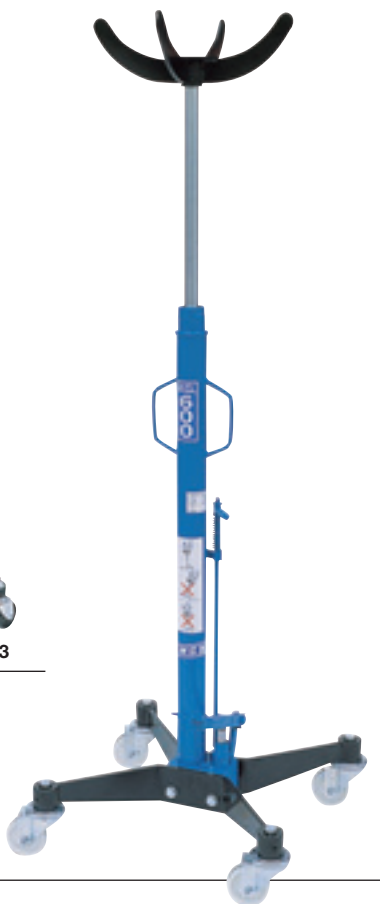
Art. SIF 2/A/73