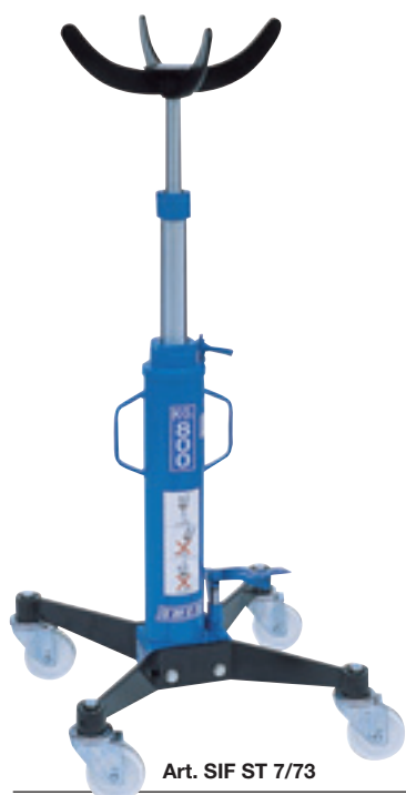
Art. SIF ST 7/73