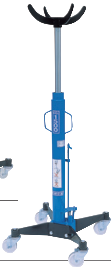
Art. SIF 3/73